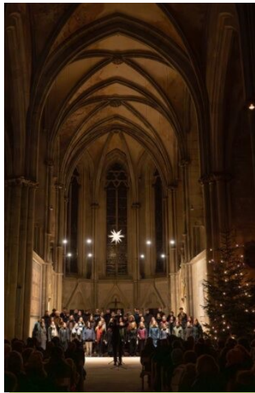
Weihnachtskonzert Schulpforte

Für gute Musik braucht es gute Musiker, aber ebenso braucht es gute Seelen im Dienste der Musik. Der Lobpreis für Frau Musica ist von Anbeginn des Schuljahres klangvoll allgegenwärtig und unüberhörbar an unserem wunderbaren Kloster-Schulort. Dank allen Mitwirkenden. Nur gemeinsam lassen sich Traditionen bewahren, Herausforderungen bewältigen, Ideen umsetzen. Davon zeugen die zahlreichen Veranstaltungen, wie das Martini-Gänseessen, die Ecce-Feier, Vortragsabende, Gewandhauskonzertfahrten.