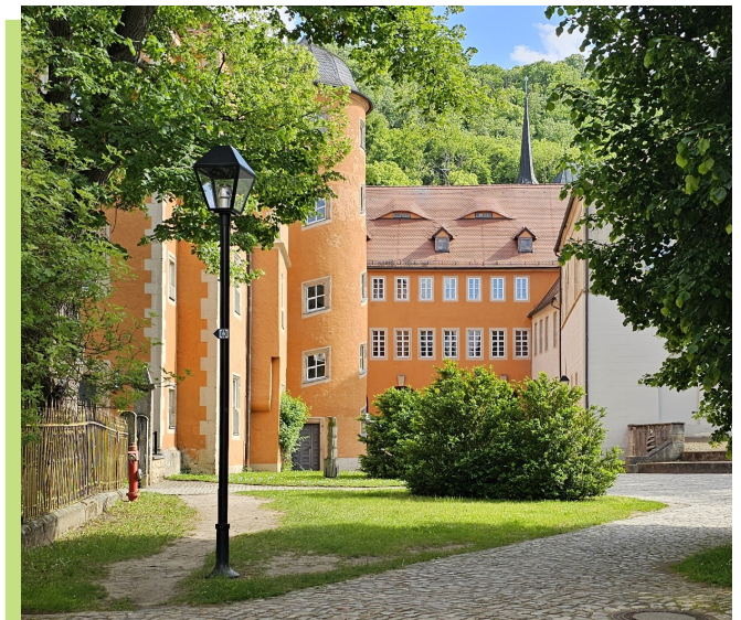
Blick zu Fürstenhaus, Arkadengang „Klopstockhalle“ und Kirche

Am 27. Januar wurde auf Initiative von Frau Stawitzke der Gedenktag an die Opfer des Nationalsozialismus gemeinschaftlich in tiefgründiger Auseinandersetzung mit dem Bereich der Holocaust-Leugnung thematisch be-