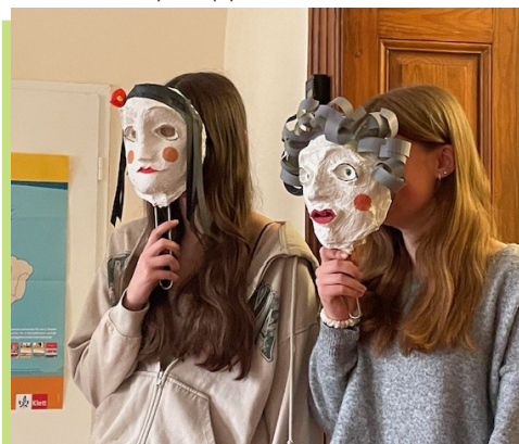
Maskenarbeit beim Griechisch-Workshop

Danach ging es in die kreative Phase: Einige stellten – unterstützt von Herrn Gläser – wunderschöne Masken her und entwarfen ein Theaterstück, andere widmeten sich der Psychologie (Was ist Narzissmus?), und eine letzte Gruppe bearbeitete die